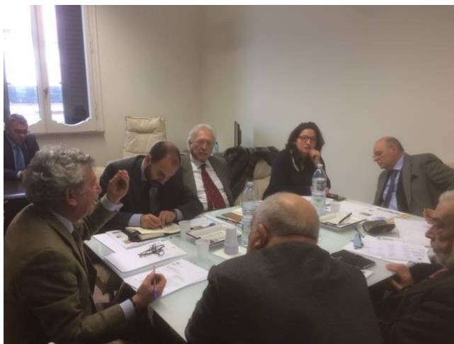
Direttivo nazionale UNAIT presso la sede CEPI

Così si è espresso il direttivo nazionale di UNAIT (Unione Nazionale Confederazioni d'Impresa del Terziario) che si è svolto oggi presso la sede di CEPI in Via del Tritone a Roma. Durante l'incontro presie-